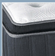
Pillow Top 舒適層