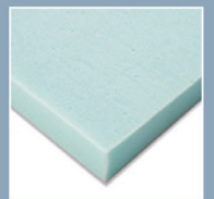
Surface Gel Technology Foam™ 涼感高科技海綿