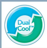
DualCool Technology™ 雙重涼感科技