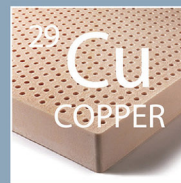
Copper-Infused™ Latex Foam 創新銅離子抗菌乳膠