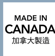
Made in Canada (加拿大製造)