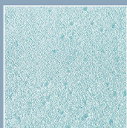
CoolGel Support Foam 高機能涼感海綿