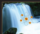
e-ION CRYSTAL® 負離子纖維