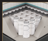
Coil on Coil 雙層彈簧結構科技