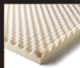
Convoluted Foam 旋繞式高密度泡綿